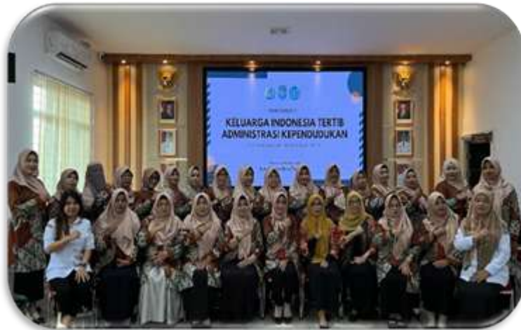
Gambar 3. Foto bersama kegiatan PKM oleh tim peneliti Fakultas Hukum Universitas Panca Bhakti

PKK tidak hanya menjadi penerima informasi, tetapi juga menjadi produsen konten edukasi hukum.