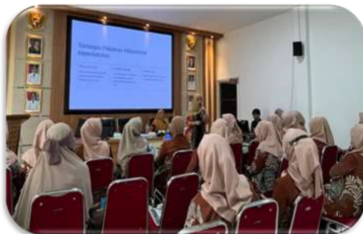
Gambar 2. Pemaparan materi dan tanya jawab kegiatan PKM Desa Parit Baru

Salah satu hasil utama dari kegiatan PKM ini adalah menguatnya peran PKK Desa sebagai agen edukasi hukum administrasi kependudukan melalui Program Keluarga Indonesia Sadar Administrasi Kependudukan (KISAK). PKK Desa terbukti memiliki posisi strategis karena kedekatannya dengan keluarga dan rutinitas kegiatan yang berkelanjutan di tingkat desa. Melalui PKM ini, kader PKK tidak hanya menjadi peserta, tetapi juga dilatih untuk menjadi fasilitator edukasi hukum. Hasil pelatihan menunjukkan peningkatan kapasitas kader PKK dalam memahami materi administrasi kependudukan dan menyampaikannya kembali kepada masyarakat. PKK Desa mulai memosisikan diri sebagai penghubung antara kebijakan administrasi kependudukan pemerintah dan kebutuhan informasi masyarakat.