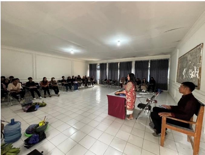
Gambar 1 . Tahapan persiapan: Pertemuan dengan mahasiswa untuk menjelaskan tujuan dari program dan memberikan materi.