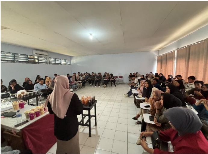
Gambar 3. Tahapan Evaluasi: Mengukur sejauh mana keterampilan mahasiswa dalam pembuatan produk, desain kemasan, dan pemasaran digital.