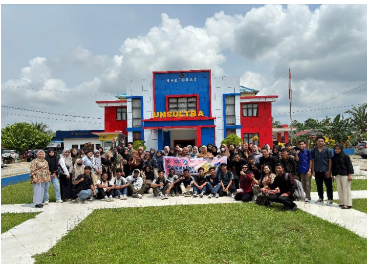
Gambar 4. Foto Bersama pelaksana program pengabdian dan mahasiswa