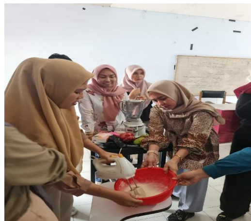
Gambar 2. Tahapan pelaksanaan: Bimbingan terhadap mahasiswa dalam pembuatan keripik pisang dan smoothies