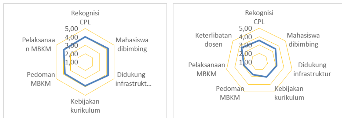
Gambar 1. Kondisi Pelaksanaan MBKM tingkat Mahasiswa dan Dosen

Mahasiswa mengetahui tentang kebijakan Merdeka Belajar-Kampus Merdeka (MBKM) dimana yang mengetahui kebijakan secara keseluruhan sebanyak 10,61%, yang mengetahui sebagian besar isi kebijakannya sebanyak 43,31%, yang mengetahui sedikit sebanyak 38,81%, dan yang belum mengetahui sama sekali sebanyak 7,27%. Sedangkan dosen yang mengetahui tentang kebijakan Merdeka Belajar-Kampus Merdeka (MBKM) terdiri dari mengetahui kebijakan secara keseluruhan sebanyak 19,61%, mengetahui sebagian besar isi kebijakannya sebanyak 66,67%, mengetahui sedikit sebanyak 13,73% dan yang belum mengetahui sama sekali tidak ada. Tenaga kependidikan yang mengetahui tentang kebijakan Merdeka Belajar-Kampus Merdeka (MBKM) terdiri dari yang mengetahui kebijakan secara keseluruhan tidak ada, yang mengetahui sebagian besar isi kebijakannya sebanyak 54,84%, yang mengetahui sedikit sebanyak 45,16% dan yang belum mengetahui sama sekali 3,23%.